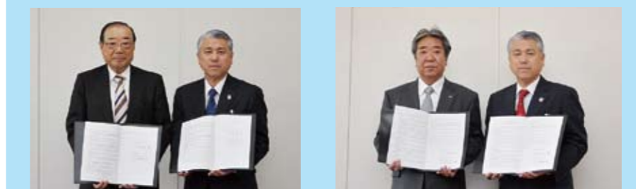
埼玉県トラック協会熊谷支部 協同組合熊谷流通センター