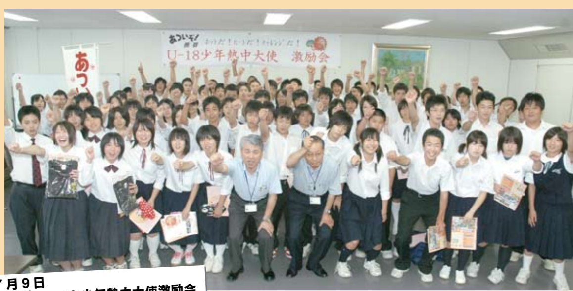
7月9日 あつぞ! U-18少年熱中大使激励会

市役所6階会議室で激励会が開催され、埼玉県学校総合体育大会に出場する市内中学生に、大使決定書とプレミアム版「あつぞ!熊谷」Tシャツが贈られ、中学生の代表から大会への抱負が述べられました。