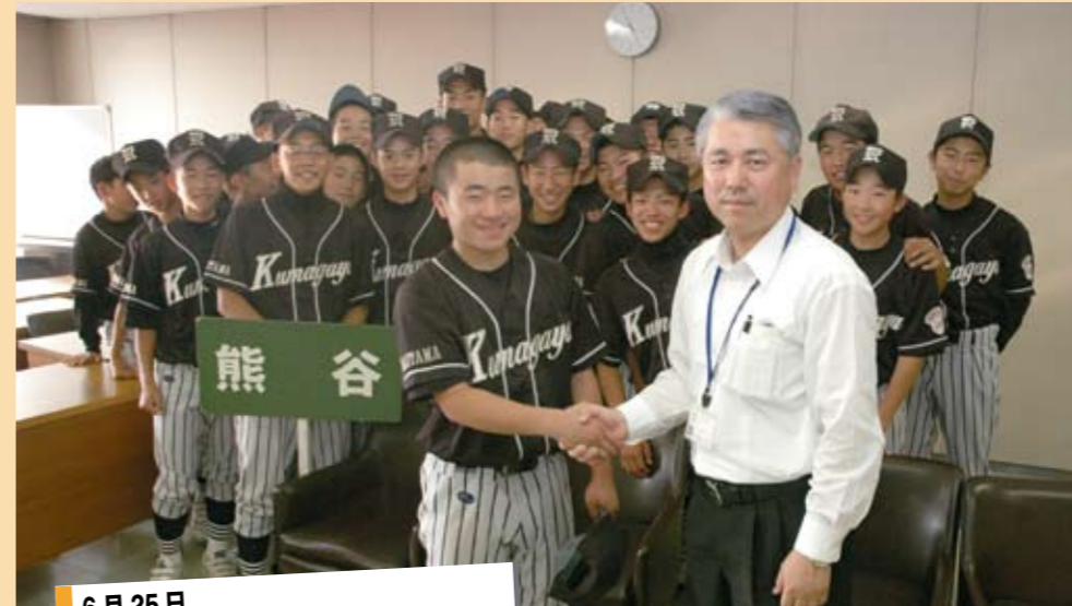
6月25日 「熊谷リトルシニア」市長表敬

市役所6階会議室で激励会が開催され、埼玉県学校総合体育大会に出場する市内中学生に、大使決定書とプレミアム版「あつぞ!熊谷」Tシャツが贈られ、中学生の代表から大会への抱負が述べられました。