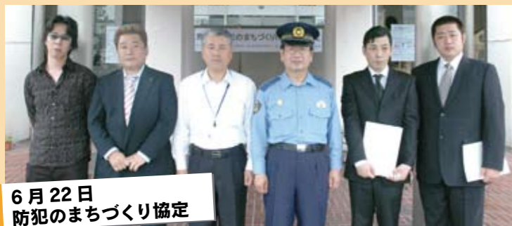
6月22日 防犯のまちづくり協定

創立5年目を迎えた中学生の硬式野球チームである「熊谷リトルシニア」が、関東野球連盟春季大会で優秀な成績を収め、宮城県大崎市ほかで7月末に開催される全国選抜大会に出場を決め、市長を表敬訪問しました。