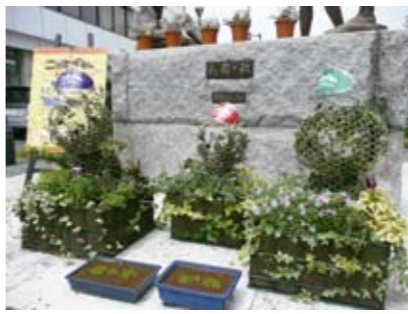
ニャオざねトピアリー

風の道をつくるなどして、街中を冷やす取組みがヒートアイランド対策なんじゃ。 ニャオざね にゃんとなく違いはわかったけど、熊谷市が進めている「あっぱれ!熊谷流」プロジェクトの中では、どんな取組みがあるのじゃ? 博士 二酸化炭素を排出しない住宅用太陽光発電システ