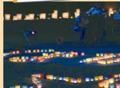
6月20日 キャンドルナイト in くまがや オープニングイベント

中央公園で、電気を消してスローな夜を感じようと、キャンドルイルミネーションとコンサートが行われました。キャンドルナイトは10月までの間、市内16か所で開催されます。