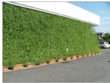
妻沼庁舎の緑のカーテン

ムを普及させたり、今年度から新たに取組んでおる高効率給湯機器を普及させるための補助事業が地球温暖化対策の代表格じゃの。 そうそう、天然ガス自動車に買い換える低公害車導入事業も、地球温暖化防止に貢献するんじゃ。 ニャオざね ふーん。いろいろあるんだにゃ。 博士 そして、中学校・公民館・市役所などの市有施設の屋上や壁面の緑化を進める事業やふるさと森づくり事業、冷却ミスト事業や打ち水などがヒートアイランド対策の主な取組みじゃな。ただし、地球温暖化とヒートアイランドは、原因に共通する部分も多いんじゃ。 ニャオざね 壁面緑化といえ、去年の妻沼庁舎のゴーヤの緑のカーテンは、すばりしかったにゃ。