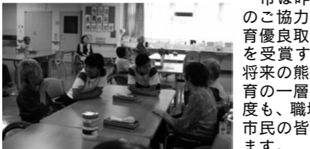
社会福祉施設での体験活動

市では、市内17校の中学1年生(または2年生)が、キャリア教育の一環として地域の事業所や店舗、社会福祉施設等で職場体験活動を行います。