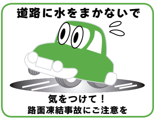
道路に水をまかないで 気をつけて! 路面凍結事故にご注意を

大里地域内にある保育所の平成21年1月以降の入所申込は、現在で満2歳に達している児童からの受け入れに変更しました。 ◆保育課 ☎内線538