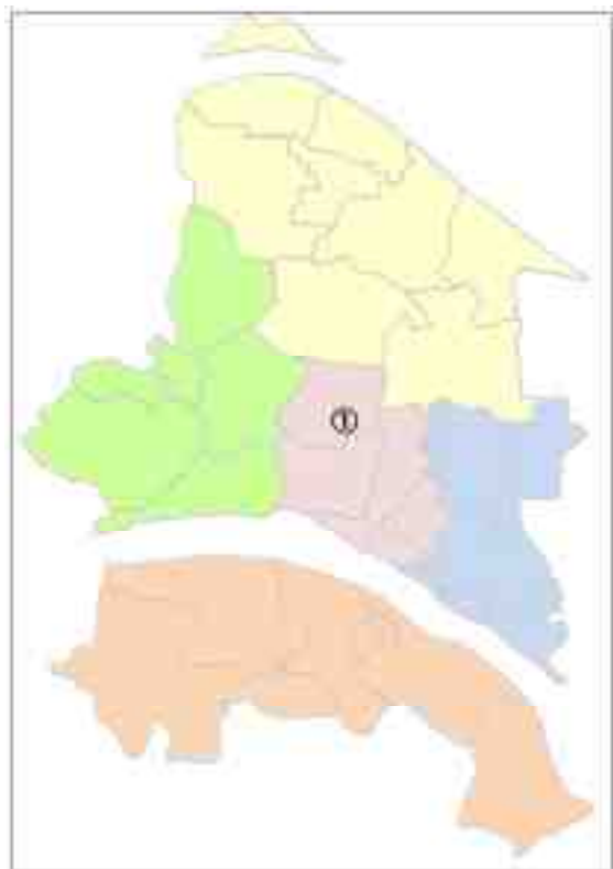
【図表 2-1-2】施設配置状況

本計画で対象とする施設の市内における配置は、図表 2-1-2 のとおりです。図表中の丸数字は、図表 2-1-1 の整理番号 (No.) に対応しています。